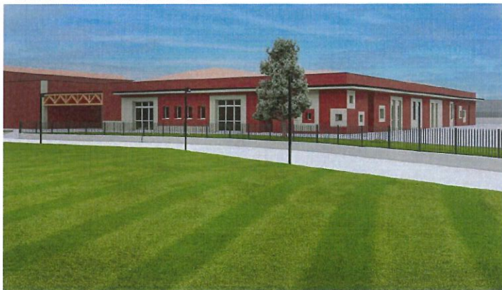
Bucaneve Società Cooperativa Sociale - Onlus

Un progetto dunque impegnativo ed ambizioso ma più mai indispensabile, condiviso anche con Ats, amministratori locali, Istituzioni provinciali e regionali, e che comporta per la Cooperativa UN INVESTIMENTO DI OLTRE 2,5 MILIONI DI EURO . La fase progettuale è COMPLETATA e abbiamo l'obiettivo di riuscire ad avviare i lavori i primi mesi dell'anno 2024.